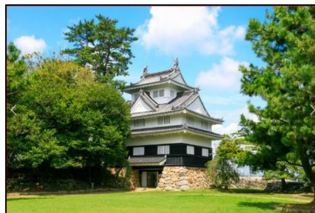
くろがねやぐら 鉄櫓