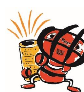
豊橋市のマスコット トヨッキー